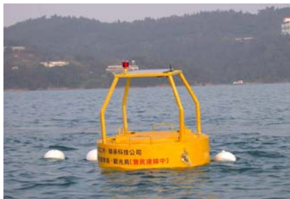
日月潭水質監測站